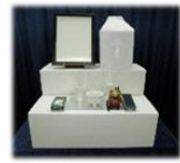
後飾り祭壇・仏具