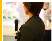
司会 プロデュース料

※1: ご遺体安置料は1日分のみ含まれております(ご遺体安置料は火葬前日まで必要となります※自宅にご安置の場合は不要)